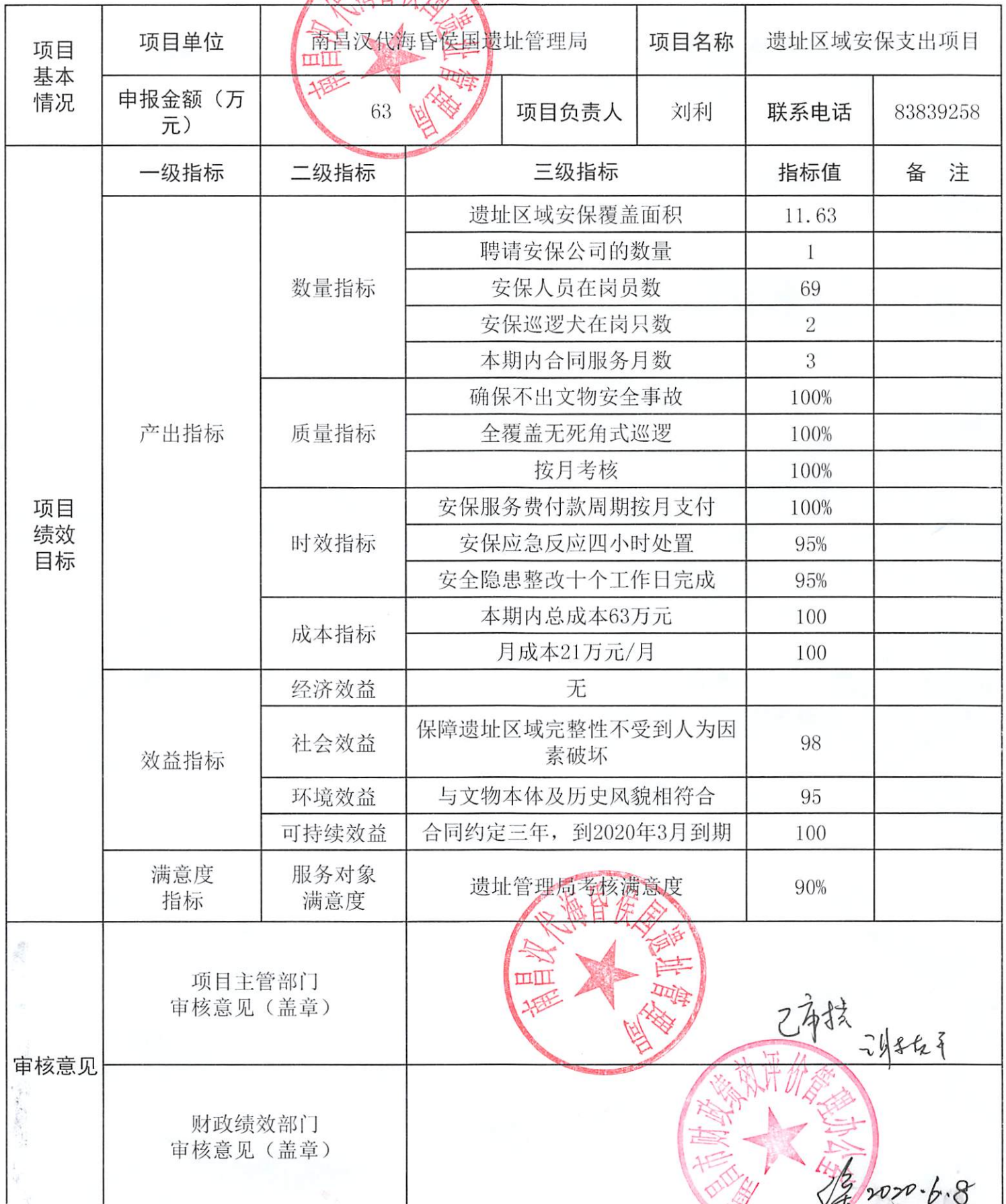
预算绩效目标批复表